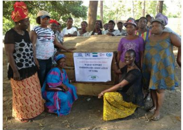
Photo 8. Les femmes mareyeuses autour du box de conservation.