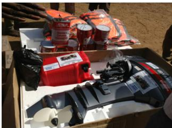
Photo 2. Moteur hors bord de 40 cv Yamaha destiné à la pirogue de surveillance. mai 2018.