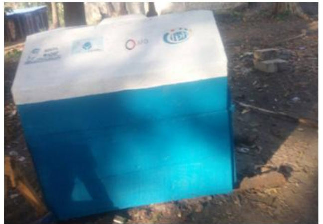
Photo 10. Le box de conservation à l'effigie des logos du projet. Cliché ADEPA, mai 2018.