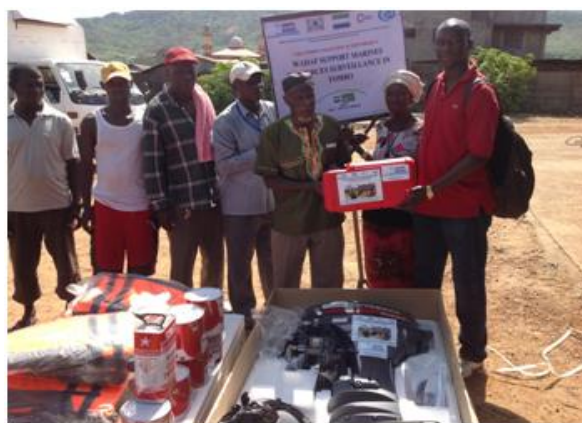
Photo 4. Remise symbolique des équipements de la pirogue de surveillance par l'équipe par l'adjoint à la coordonnatrice Cliché ADEPA, mai 2018.