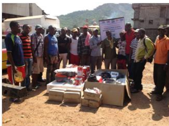
Photo 3. Les accessoires de la pirogue de surveillance. Cliché ADEPA, mai 2018.