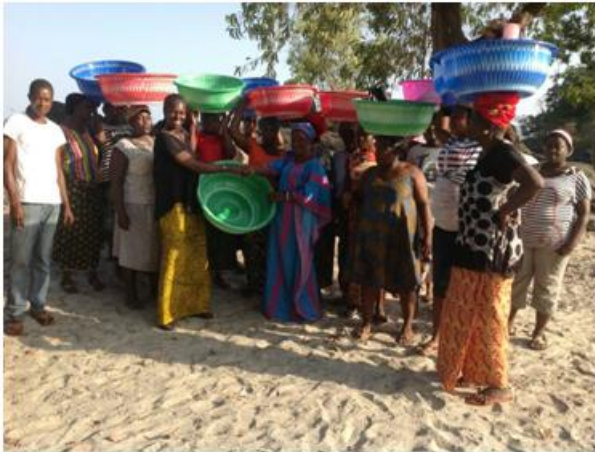
Photo 7. Les femmes mareyeuses de York reçoivent avec joie les bassines de poissons. Cliché ADEPA, mai 2018.