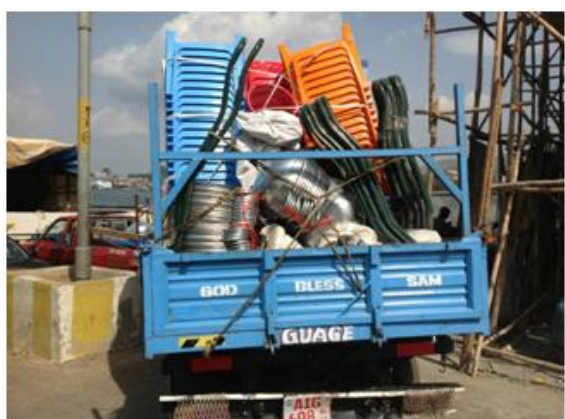
Photo 5. Les équipements achetés au profit de Tamaraneh de Conakry Dee Lungi acheminé vers la localité. Cliché ADEPA, mai 2018.