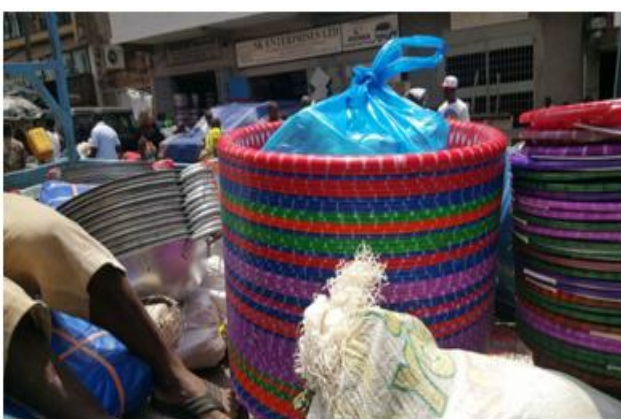
Photo 6. Le lot des équipements mis à la disposition de Tamaraneh de Conakry Dee Lungi.