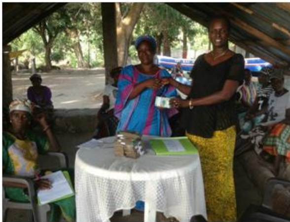
Photo 9. Les femmes mareyeuses qui reçoivent des mains de la coordonnatrice le fonds de crédit.